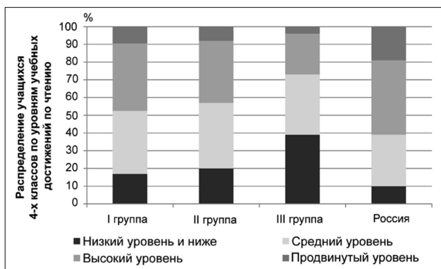
Рис. 1. Распределение учащихся по уровню сформированности читательских умений (по данным PIRLS-2006) [Агранович, Ковалева и др., 2009. С. 49]

Сформированность читательских умений выпускников начальной школы