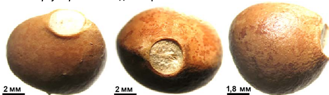
Рис. 7. Насіння Staphylea pinnata (збільш. у 6,5 разів)

Tamarix gracilis (Tamaricaceae) – реліктовий вид, ареал якого охоплює територію південного сходу Європи та Центральної Азії: Кавказ (Дагестан), пониззя річок Дону та Волги, Західний Сибір, Середню Азію, Монголію. В Україні знаходиться на північно-західній межі ареалу, зростає на узбережжі Азовського моря у Донецькій, Херсонській, Запорізькій областях та Криму (Червона книга ..., 2009). В колекції рідкісних рослин дендропарку з 2005 р. – біогрупа складається з 5 рослин. Листопадний чагарник 1,5–3,0 м заввишки з бурувато-каштановою (на молодих) і коричневою (на старших пагонах) корою. Плід – тригніздна, багатонасінна коробочка, 4–6 мм завдовжки, дозріває у другій половині червня. Насінини веретеноподібні, дрібні, темно-коричневі, до 2 мм завдовжки, з білим