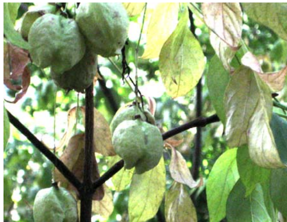
Рис. 6. Staphylea pinnata з плодами-коробочками

Вид повторно інтродукований до дендропарку на початку 70-х років XX ст., на теперішній час натуралізувався і сформував інтродукційну популяцію площею 1200 м 2 . Листопадний чагарник до 5 м заввишки. Плід – поникла, перепончаста, широкооберненояцеподібна, трилопатева, здута коробочка із шкірястими стінками, що відкривається на верхівці, зеленуватого кольору, до 3 см у діаметрі, з 1–2, рідко 3–4 насінинами (рис. 6). Насінини Staphylea pinnata частіше широкояцеподібні, рідше округлі, блискучі, з дуже добре помітним насіннєвим рубчиком, бурі, 8,9–9,8 мм завдовжки, 9,5–10,4 мм завширшки, до 15 мм у діаметрі. Колір насіння змінюється від світло- до темно-бурого по мірі його дозрівання. Маса 1000 насінин досягає 331–526 г, в 1 г – 2–3 насінини (рис. 7).