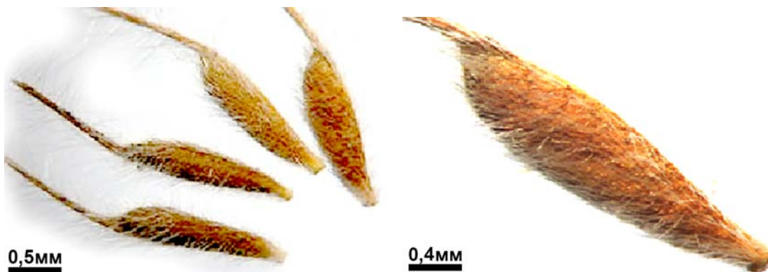
Рис. 9. Насіння Dryas octopetala (збільш. у 10–20 разів)

В колекції рідкісних рослин дендропарку з 2006 р., зимовозелений чагарничок із сланким розгалуженим стеблом 2–10 см заввишки, займає площу 1,0 м 2 . Плодоносити почав у дворічному віці, період достигання плодів є розтягнутим, починається в II–III декадах травня і триває 20–30 днів. Плід – округлий багатогорішок, до якого зібрані горішки – еліптичні, коричневі, волохаті, з видовженим пірчасто-волосистим залишком стовпчика маточки – апікальним носиком, 2,5–4 мм завдовжки (рис. 9).