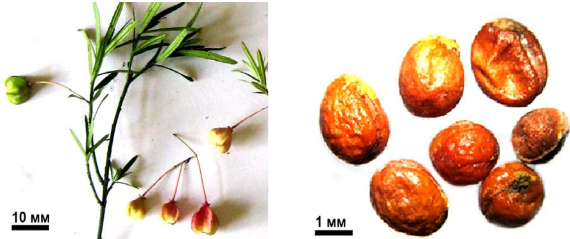
Рис. 2. Плоди Euonymus alba та насінини (збільш. у 6,5 разів)

Низькорослий сланкий зимовозелений чагарник із висхідними гілками, рідко прямостоячий, 20–100 см заввишки, інтродукований до дендропарку у 1958 р. На теперішній час займає площу біля 100 м 2 . Плід – чотирихгніздна коробочка, яскраво-рожевого кольору, 12 мм завдовжки і 10 мм завширшки, дозріває у III декаді серпня. Насінини кулясті або неправильноїцеподібні, дрібні, бурувато-червоні, блискучі, з двома повздовжніми борозенками, 2–3 мм у діаметрі (рис. 2).