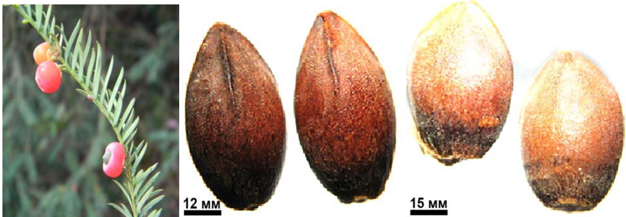
Рис. 1. Taxus baccata : насіння з арилюсом; насінини (збільш. у 6,5 разів)

Зимовозелене дерево або чагарник, повторно інтродукований до дендропарку у 1950 р. Рослини у віці 60 років досягли 7 м заввишки і 12 см у діаметрі. Насінний зачаток поодинокий, кінцевий, біля основи оточений м'ясистим арилюсом, який при досягненні насінини розростається і червоніє. Насіння овально-яйцеподібне, 2-гранне, загострене, трішки сплюснене з боків, гладеньке, оливково-коричневе, блискуче, з добре помітною борозенкою, із твердою оболонкою і буруватою насінневою шкіркою, 5,4–7,0 мм завдовжки, 3,8–5,0 мм завширшки, дозріває у другій половині вересня (рис. 1). Одним з основних показників якості насіння є маса 1000 насінин, яка змінюється відносно його розмірів. У Taxus baccata в умовах дендропарку «Олександрія» вона коливається в межах 47–87 г, а кількість насінин в 1 г – 12–20 штук.