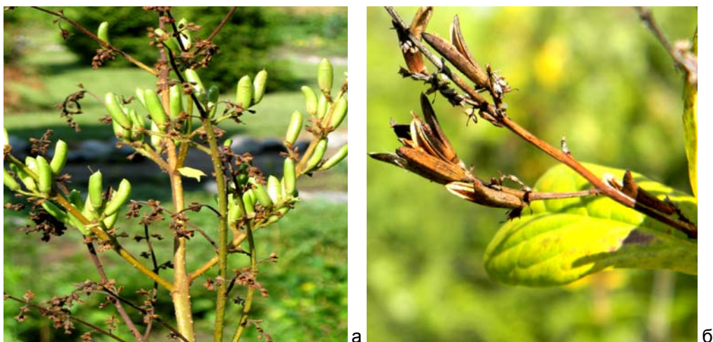
Рис. 3. Плоди Syringa josikaea : а) незрілі у липні; б) зрілі у вересні

До дендропарку вид інтродукований у 1950 р., на теперішній час біогрупи займають площу 200 м 2 . Листопадний чагарник 3–4 м заввишки. Плід – двогніздна, тупа, гладенька коробочка, коричневого кольору, із 2–3 плоскими насінинами. В умовах дендропарку дозріває з кінця серпня до середини вересня (рис. 3).