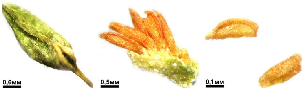
Рис. 5. Плід Spiraea polonica (збільш. у 20 разів) та насінини Spiraea polonica (збільш. у 50 разів)

В колекції дендропарку з 2005 р., на теперішній час 4 біогрупи займають площу біля 50 м 2 . Листопадний чагарник 1–1,5 м заввишки, в умовах дендропарку розмножується насінням і дає паростки. Плід – опушена рідкими волосками, продовгувато-яйцеподібна, жовтувато-зелена листянка з ніжкою, яка відкриваються по вентральному війчастому шву із черевного боку, 3 мм завдовжки, дозріває у першій половині липня. Насінини ланцетоподібні, трохи зігнуті, з борозенками, жовтувато-бурі, дрібні, 0,4 мм завдовжки (рис. 5).