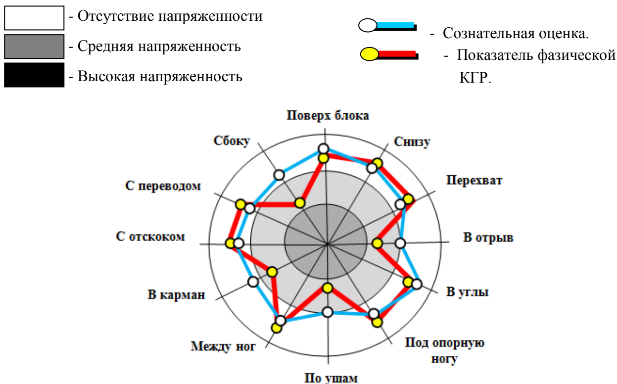
Рис 2. Психологический профиль сознательной оценки выполнения броска гандболисткой и показателя физической составляющей при воздействии семантическими раздражителями шаблона "Броски в гандболе"

Результаты исследования. Знакомство с командой начали с исследования ресурса межличностных взаимоотношений. У значительного количества игроков межличностные взаимоотношения оказались проблемной зоной. На рис.1 представлена диаграмма межличностных отношений одной из спортсменок с игроками команды, позволяющая выявить ресурс для повышения ее производительности в спортивной деятельности.