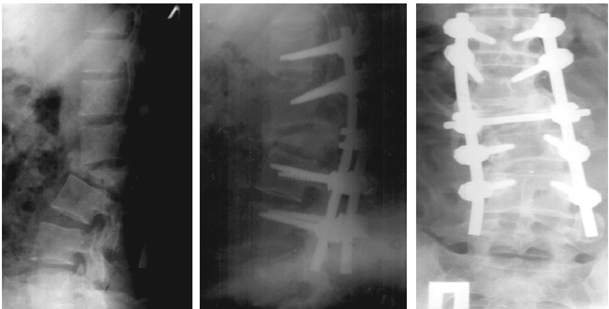
Рис. 2. Функціональна рентгенографія цифрова поперекового відділу хребта в сагітальній площині хв. Р., 47 років компресійно-скалковий перелом тіла L2 III ст., що призвело до улового кіфозу на рівні L1- L2, фіксований металоостеосинтез (задній спондилодез на рівні Th12- L4) стабільний при виконанні максимального згинання та розгинання поперекового відділу хребта; ретролістез L2 (до 6мм, фіксований при функціональній спондилограмі) і L3 (до 3мм фіксований); посттравматичні дегенеративно-дистрофічні зміни I стадії, формування блоку сегментів L1-L2-L3; деформуючий спондилоз; розповсюджений остеохондроз; спондилоартроз.

травматично ураженого хребця, частіше блок формувався з каудально розташованим хребцем (рис. 2). У 4 % пацієнтів виявляли кістковий блок між суставними відростками тіл хребців. При не усунених компресійних чи скалкових переломах виявляли нестабільність в уражених сегментах (рис. 3).