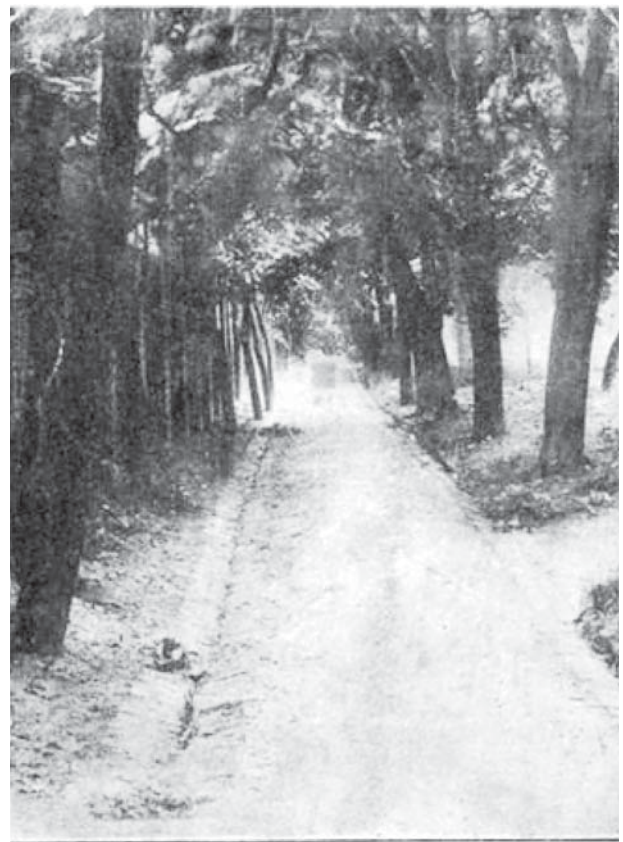
Бульварно - Кудрявская Санаторія, Кієв, Б.-Кудрявская, № 27.