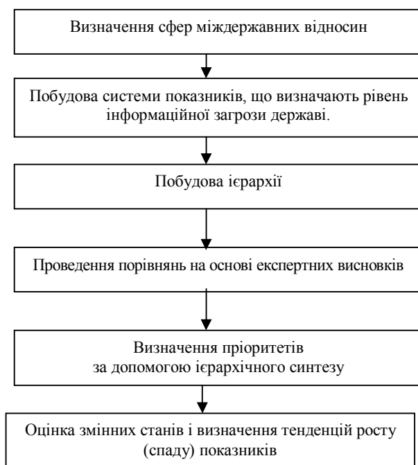
Рис. 1. Послідовність визначення пріоритетів окремих показників, що характеризують рівень інформаційної загрози

Матриця парних порівнянь для визначення пріоритетів сфер міждержавних відносин має вигляд: