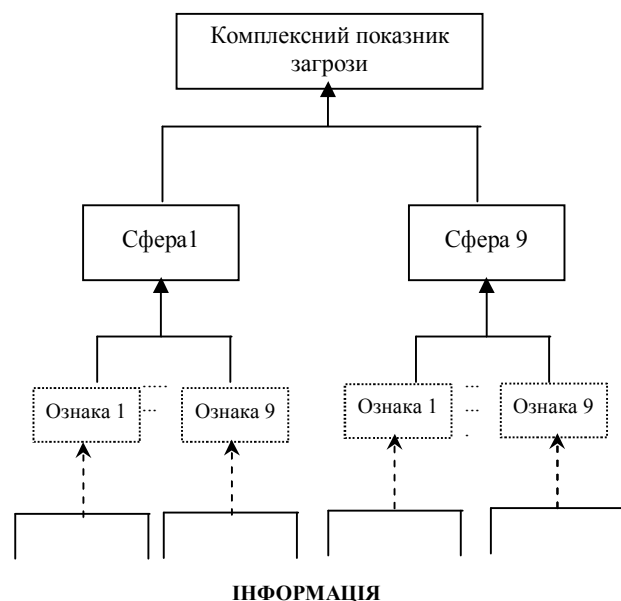
Рис. 2. Узагальнена схема ієрархії знаходження пріоритетів окремих показників, що визначають рівень інформаційної загрози державі