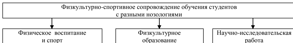
Рис. 1. Основные направления физкультурно-спортивного сопровождения обучения студентов с ограниченными возможностями здоровья

Разработанный и используемый в учебном процессе по физическому воспитанию алгоритм действий представляет собой пошаговую организационно-методическую структуру взаимосвязанных разделов, позволяющую объединить теоретическую, научно-методическую и практическую подготовку на основании оперативной информации о психофизическом состоянии студентов с ограниченными возможностями здоровья (рис. 1).