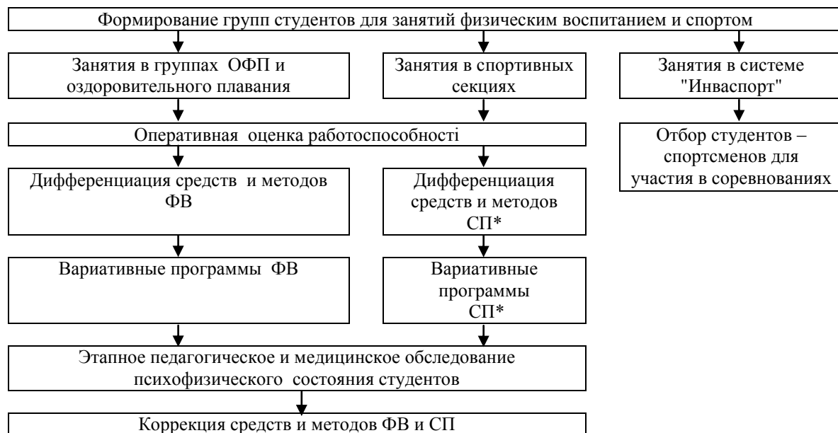
Рис. 2. Организационно-методическая структура физкультурно-спортивного сопровождения обучения студентов с ограниченными возможностями здоровья

Примечание: СП* – спортивная подготовка. СУНП "Олимпия"* – студенческое учебно-научное подразделение "Олимпия"