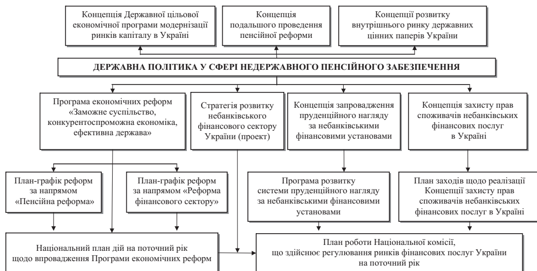
Рис. 3. Основні нормативно-правові акти державної політики у сфері недержавного пенсійного забезпечення

Основні концепції, які формують концептуальне середовище державної політики у сфері недержавного пенсійного забезпечення, наведено на рис. 3.