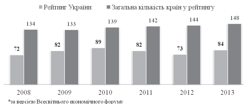
Рис. 1. Динаміка зміни індексу глобальної конкурентоспроможності України у 2008-2013 рр. (складено за даними [6])

ресурсоемності ВВП країни свідчить про неефективне використання ресурсів, що обумовлює зниження рентабельності виробництва, зростання собівартості продукції і, відповідно, гальмує перехід на інноваційний ресурсозберігаючий тип розвитку. Крім того, за оцінками експертів в економіці України домінують третій і четвертий технологічні уклади виробництва продукції [7], що також є загрозою її конкурентоспроможності.