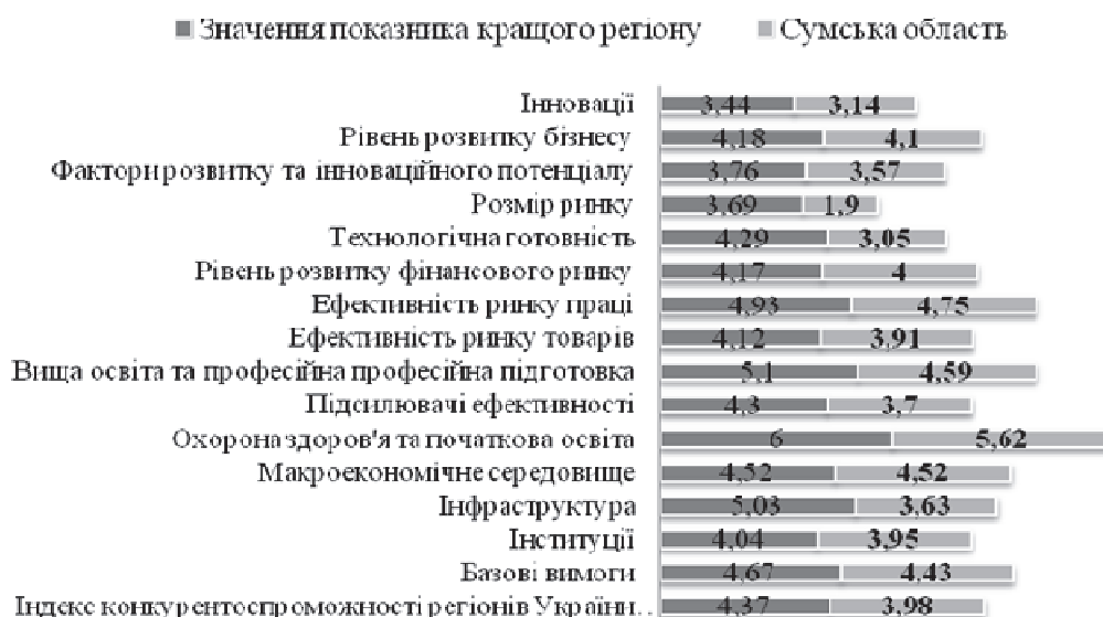
Рис. 3. Результати оцінки Сумської області за 12 складовими конкурентоспроможності (складено за даними [5])

З метою пошуку резервів зростання конкурентоспроможності області нами було здійснено оцінку ефективності ресурсокористування у регіонах України. Зважаючи на наявну статистичну інформацію та цілі нашого дослідження, для оцінки резервів й аналізу напрямів раціоналізації ресурсокористування використовувалися такі часткові показники ресурсовитрат: водо-, відходо-, повітро-, паливо- та капіталоємність валового регіонального продукту (ВРП), що характеризують матеріальну складову ресурсокористування.