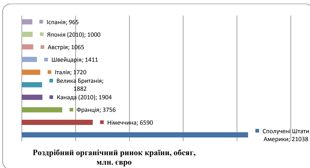
Рис. 1. Десять країн світу з найбільшими ринками органічної харчової продукції, 2011 р. [1]

Найбільший обсяг роздрібного органічного ринку мають такі країни як США (21038 млн. євро), Німеччина (6590 млн. євро), Франція (3756 млн. євро), Канада (1904 млн. євро у 2010 р.), Велика Британія (1882 млн. євро), Італія (1720 млн. євро), Швейцарія (1411 млн. євро), Австрія (1065 млн. євро), Японія (1000 млн. євро у 2010 р.) та Іспанія (965 млн. євро) (рис. 1).