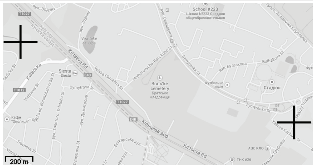
Рис. 1. Розміщення Борщагівського колектора: А – місце витікання р. Нивка в колектор, Б – місце витікання р. Нивка з колектора.