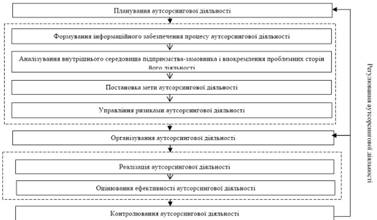
Рис. 1. Етапи здійснення аутсорсингової діяльності виробничими підприємствами