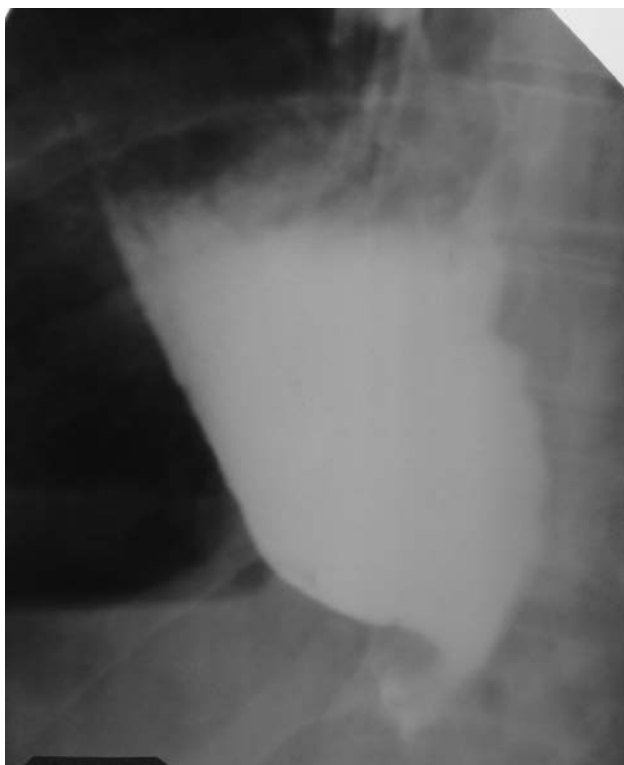
Рис. 4. Рентгенография желудка после операции Льюиса. Полное отсутствие эвакуации контраста из культи желудка вследствие его ротации

Механическая непроходимость также наблюдалась в одном случае после операции Льюиса, когда имелась ротация желудочного трансплантата. Осложнение было диагностировано на 7 сутки при рентгенисследовании (рис. 4). Барий и даже водорастворимый контраст не поступали в кишечник. Больному произведена релапаротомия, разрушены сращения в области диафрагмального отверстия, проведен зонд в культю желудка и кишку через область перекрута для кормления. Больной находился на зондовом питании. Через 8 дней в связи с перерастяжением культи желудка наступила частичная несостоятельность пищеводно-желудочного анастомоза и развилась ограниченная эмпиема плевры. Произведено дренирование плевральной полости и ее санация. Больной выписан домой по настоянию родственников, поэтому дальнейшая его судьба не известна.