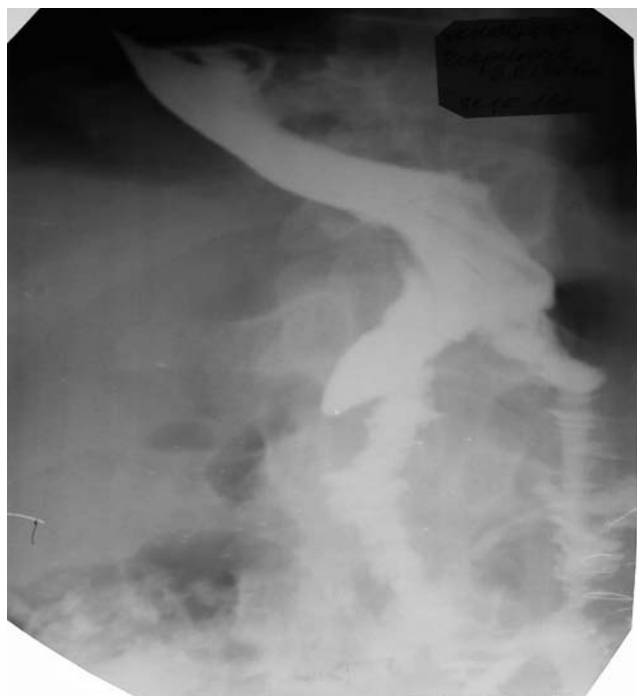
Рис. 3. Рентгенограмма желудка того же больного на 5-е сутки после релапаротомии и наложения гастроэнтероанастомоза. Эвакуация контраста только через анастомоз