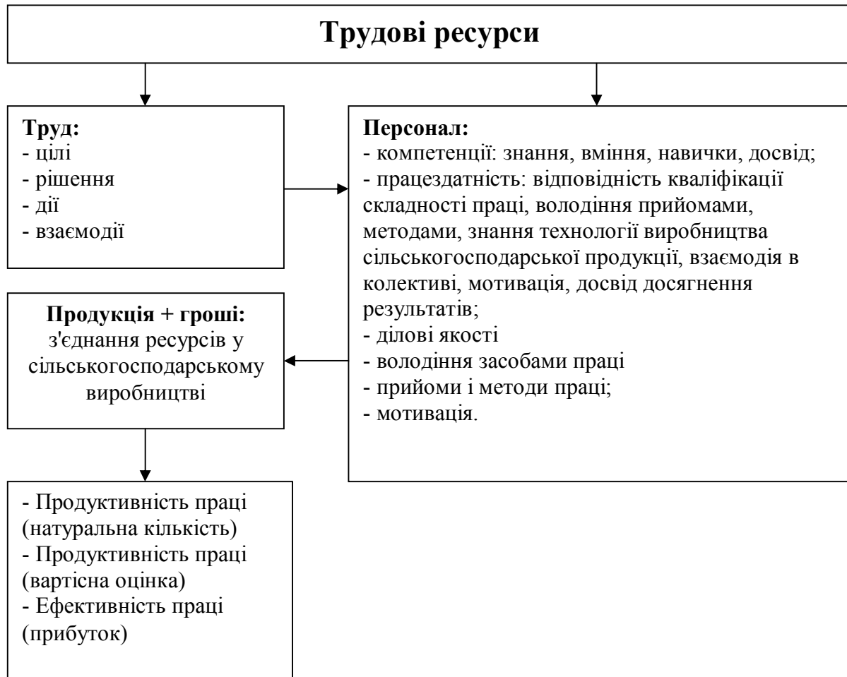
Рис. 2. Схема трудових ресурсів

До складу трудових ресурсів відносять: працю (виконання процесів, взаємодію в команді, з'єднання ресурсів у продукцію та її продаж); та персонал (компетентний і працездатний); продукція і гроші; продуктивність і ефективність.