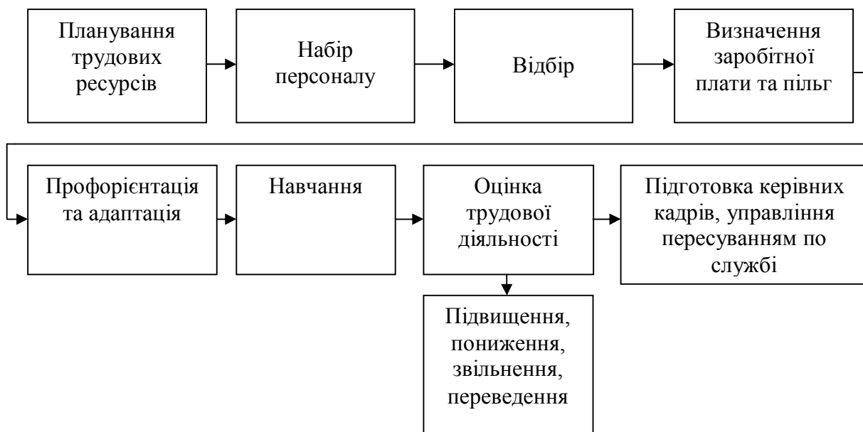
Рис. 1 Управління трудовими ресурсами