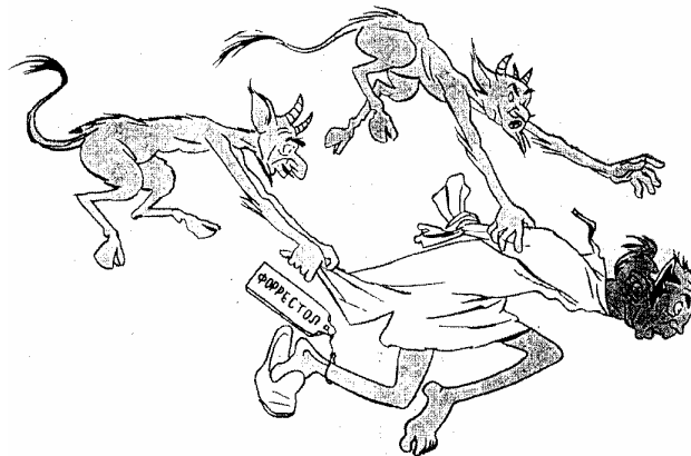
Форрестол в аду. Черти: – Держи его крепче! Не то он второй раз в окно выбросится 55