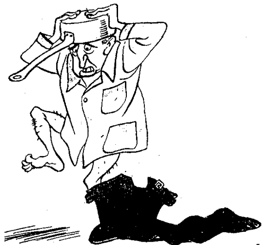
Форрестол (мания преследования) 54

Стихотворение было опубликовано в журнале «Крокодил». Там же на Форрестол появлялись карикатуры до и после его смерти.