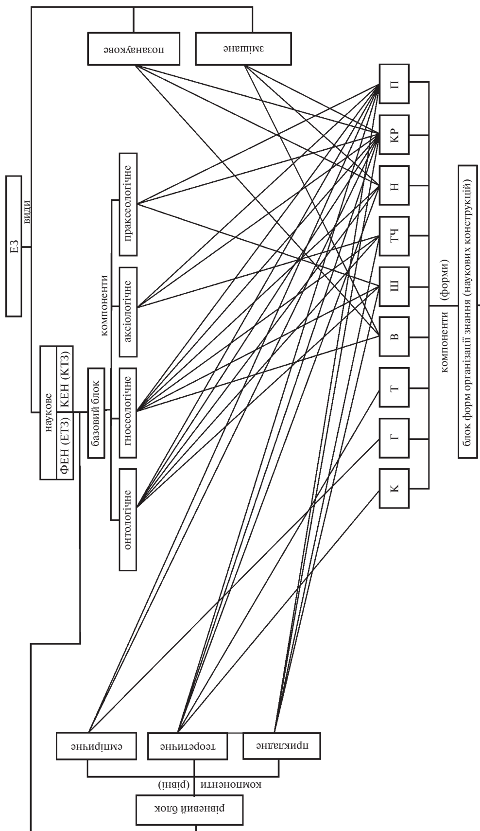
Рис. 1. Схема будови і структури Е3

Умовні позначення: К – концепція; Г – гіпотеза; Т – теорія; В – вчення; Ш – школа; ТЧ – течія; Н – напрям; КР – картина реальності; П – парадигма.