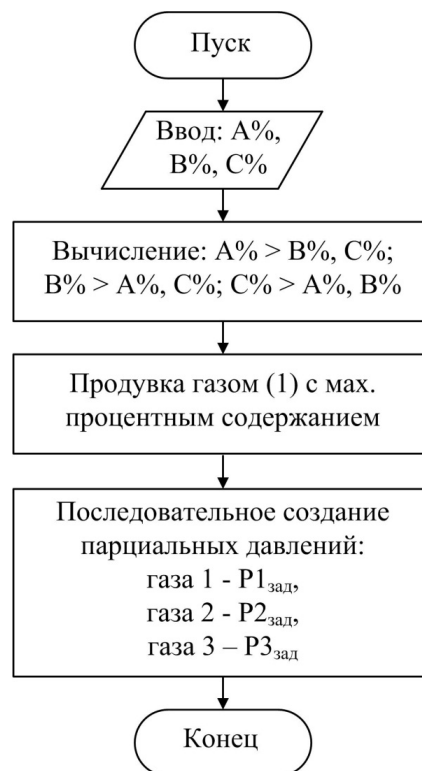
Рис. 3. Алгоритм работы системы управления

Реализация метода осуществляется микропроцессорной системой управления СУ (рис. 1). Работа СУ в режиме подготовки газовой смеси выполняется по алгоритму, представленному на рис. 3.