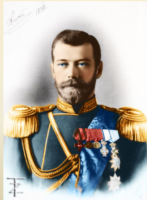
Император Николай II

В 1912 году на V Олимпийских Играх в Стокгольме Олимпийской команде России покровительствовал Император Николай II. Но удалось завоевать лишь 2 серебряные и 2 бронзовые медали. В общем командном Зачете команда России оказалась лишь на 15 месте.