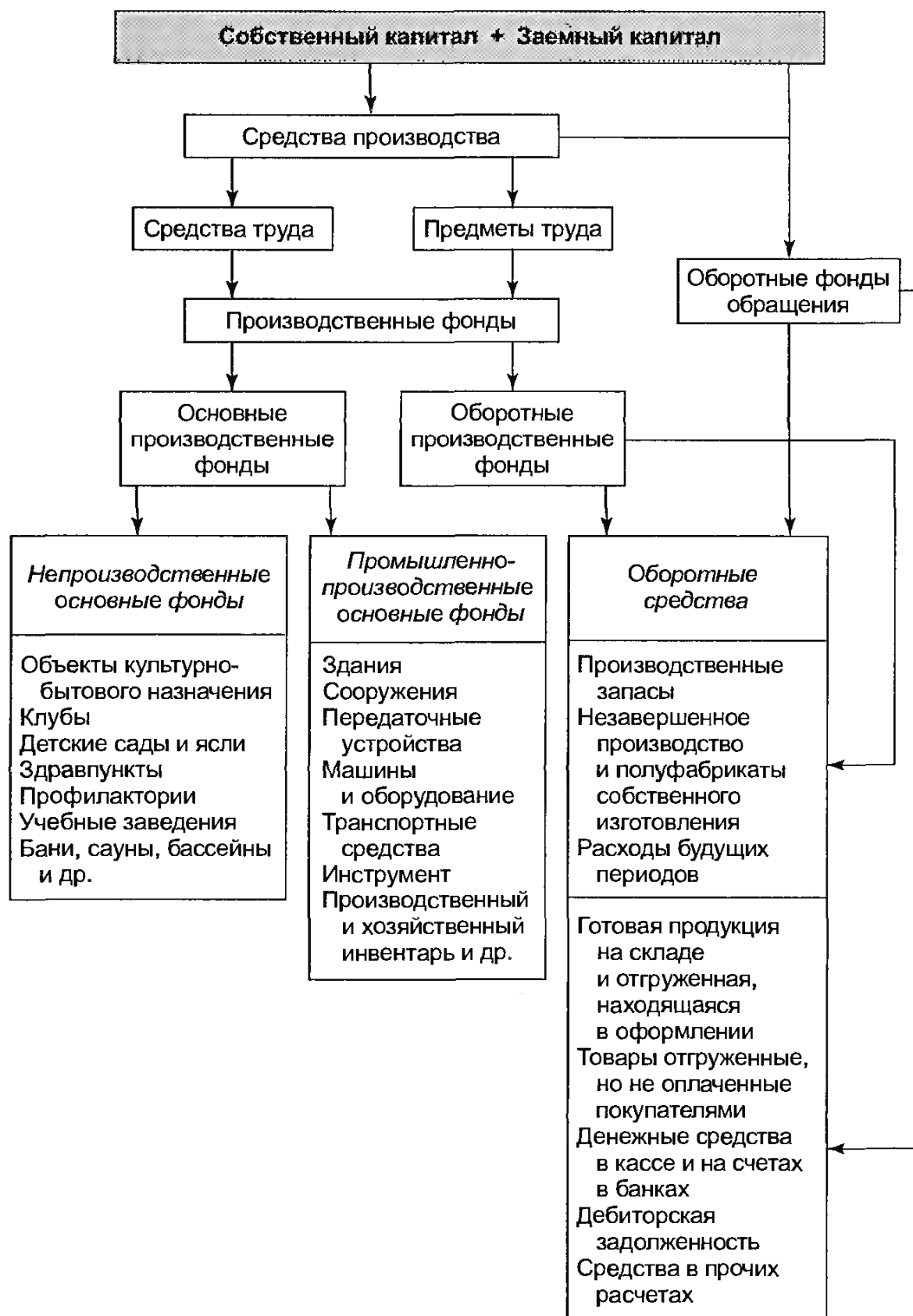
Рис. Формирование активов предприятия за счет пассивов