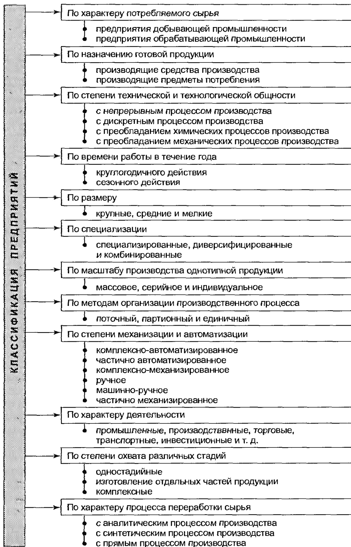
Рис . Классификация предприятий