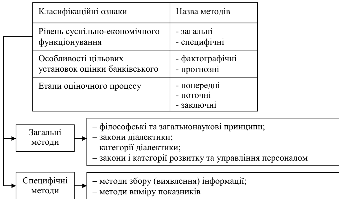
Рисунок 2 – Класифікація методів оцінки банківського персоналу

Згідно з вищенаведеною класифікацією крім загальних методів існують і специфічні методи оцінки персоналу, які, у свою чергу, поділяються на методи збору (виявлення) інформації та методи виміру показників [1] (рис. 3).