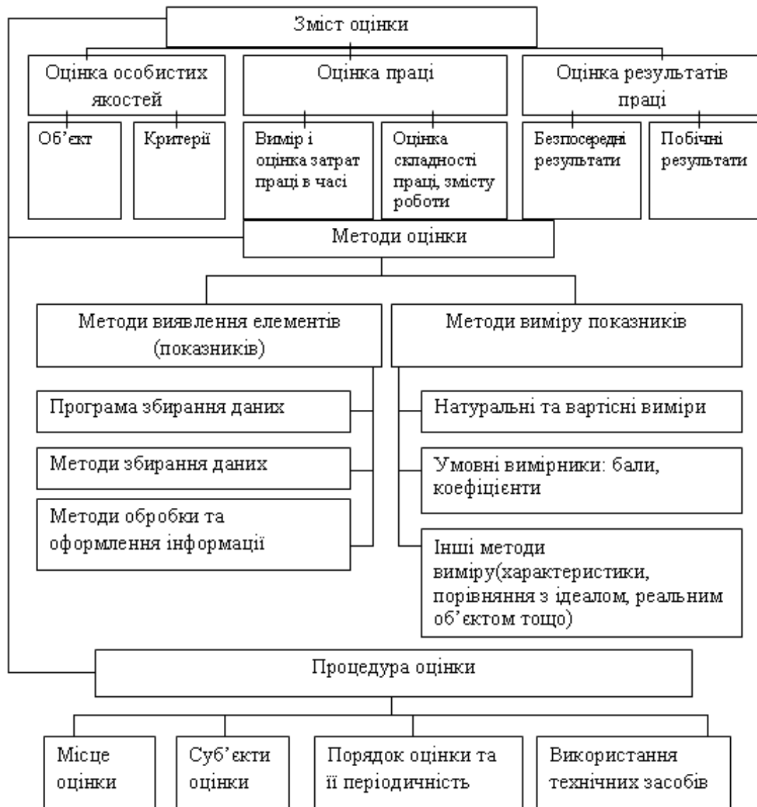
Рисунок 1 - Складові оцінки персоналу*

*Джерело: Складено автором з використанням [2]