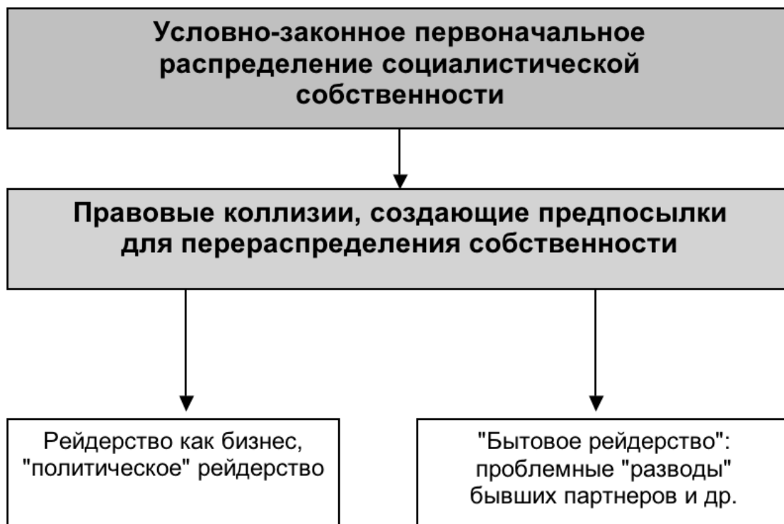
Рис. 1. Укрупненная схема перераспределения собственности

Прорехи в отечественном корпоративном законодательстве обеспечивают благодатную почву для использования организаторами рейдерских атак различных правовых коллизий в качестве casus belli . Тем более что, как говаривал упомянутый выше сын турецкоподданного «Все крупные современные состояния нажиты незаконным путем», а первичное перераспределение социалистической собственности состоялось в условиях правового вакуума (Рис. 1).