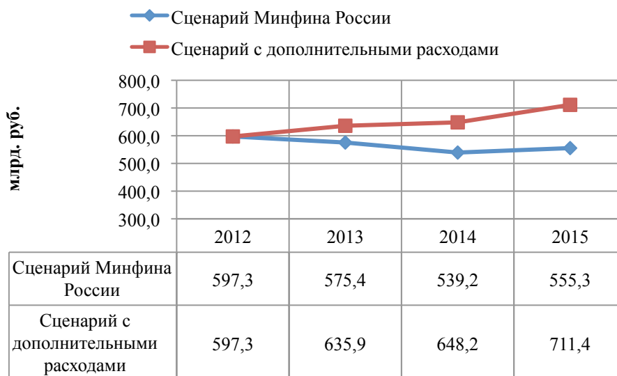
Диаграмма 1. Федеральные расходы на образование согласно сценарию Минфина России и сценария с дополнительными средствами, млрд. руб.

5. Федеральные субсидии на поддержку региональных программ развития образования. С учетом отмеченного выше дефицита средств консолидированных бюджетов субъектов регионов необходимо предусмотреть механизмы федерального софинансирования соответствующих обязательств, нацеленные на привлечение дополнительных средств в региональные образовательные системы. При расчете соответствующих обязательств целесообразно ориентироваться на сохранение объемов федеральных субсидий в рамках