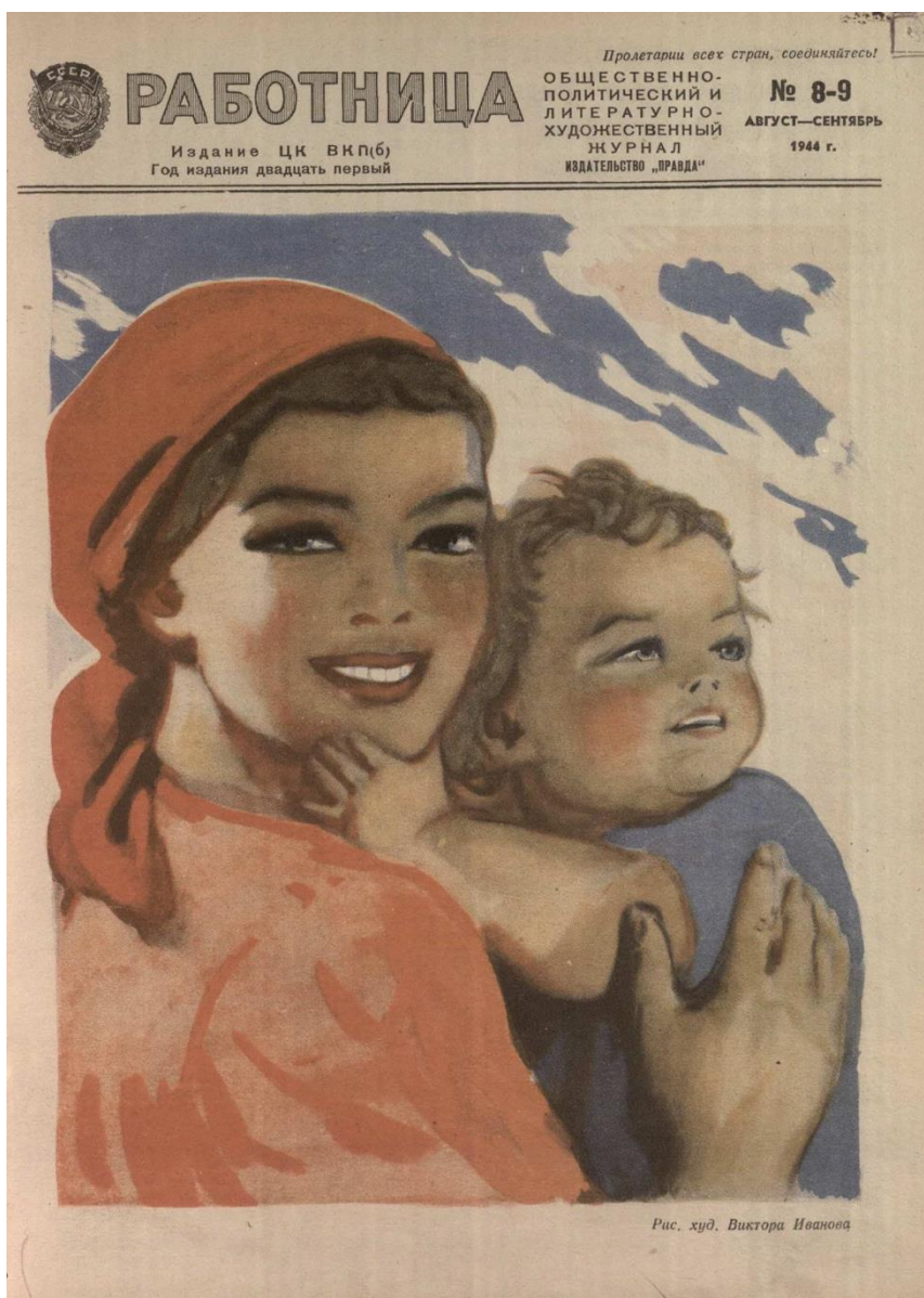
Рис. 2. Работница. 1944. № 8-9. Рис. худ. Василия Иванова. Обложка.