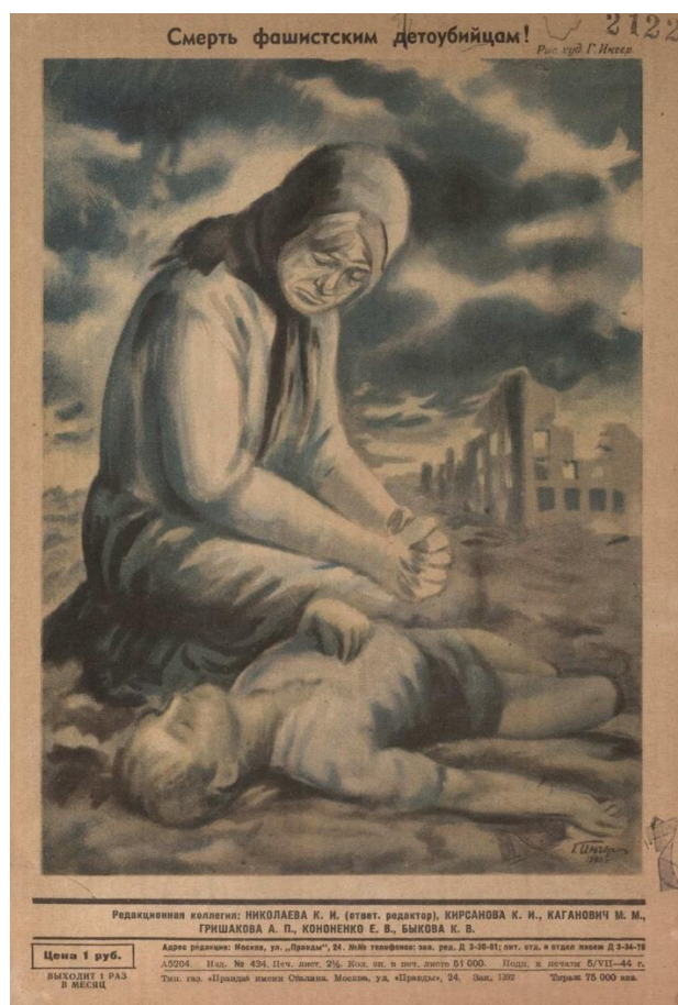
Рис. 1. Плакат «Смерть фашистским детоубийцам». Работница. 1944. № 7. С. 12.