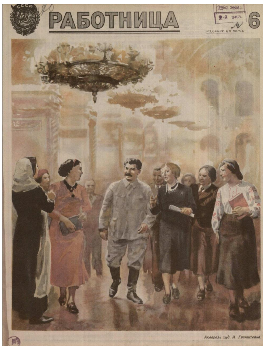
Рис. 1. Работница. 1941. № 6. Обложка. Акварель худ. И.Гринштейн.