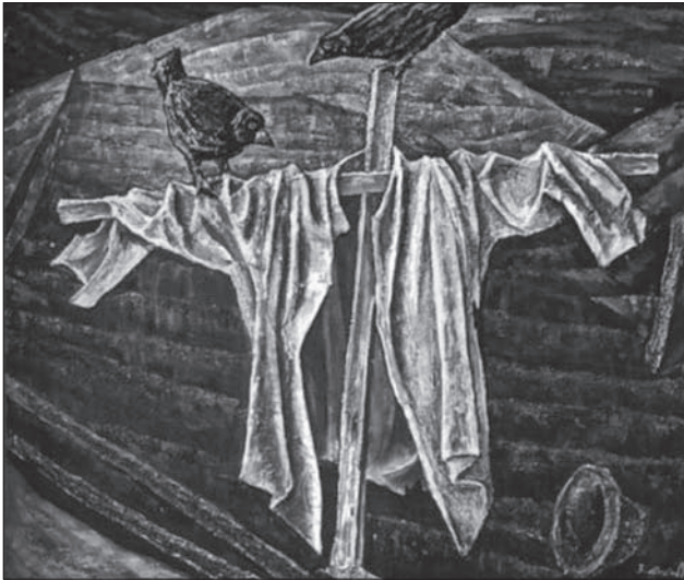
Володимир Микита. Пужало. 1981