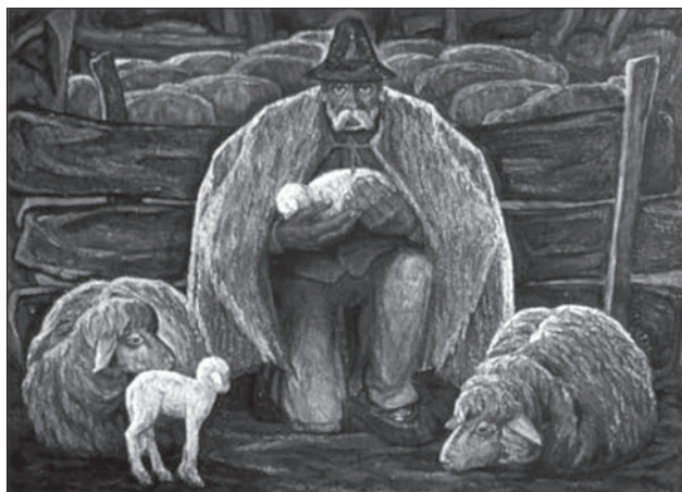
Володимир Микита. Ягнятко. 1969

площинне трактування кольору, поперемінність контрастних теплих та холодних відтінків, що відтворюється в загальному площинному вимірі, ніби композиція народного килиму або декоративного панно. Спостерігаються характерні авторські формотворчі риси констатації об'єктів, властиві митцю. Еліпсоподібні конфігурації ландшафтної поверхні гармонійно переходять у моделювання округлими лініями колоподібних крон дерев, що, в свою чергу, інтегруються в закруглені обриси гірських схилів і переходять в округлі силуети хмар. Автор свідомо позбавився академічних зобов'язань тривимірного