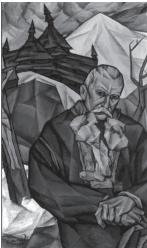
Володимир Микита. Смуток. 1966