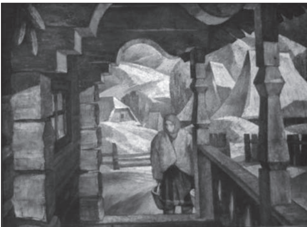
Володимир Микита. Вечірній ганок. 1982

моделювання та освоїв технічні прийоми гармонізації площини шляхом декоративно узагальнених засобів художнього відтворення.