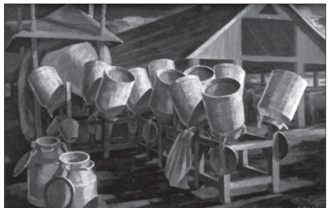
Володимир Микита. Вечірній дзвін. 1988

підвищеної характеристики зображень фігуративного ряду, як і деякі специфічні та показові прийоми пластичної метафори. «Дідо садівник» (1968), «Дідо казкар», «Ягнятко», «Смуток» (1966), «На чужині», — тому при перегляді ряду робіт, при всій множинності приватних рішень, при всій відмінності пластичних і, до певної міри, психологічних ха-