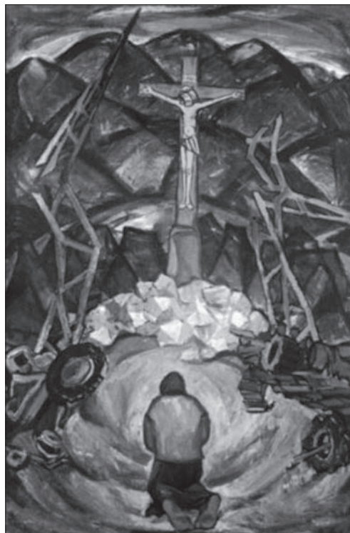
Володимир Микита. Молитва. 1968

Внутрішнє переживання художника створює основу для вибору кольорової гами та виразності конкретних асоціацій, які пов'язані зі сприйняттям проблем сьогодення. Завдяки цим прийомам і живописною системою проявляється «...сміслова і живописна композиційна єдність зображеного, які є засобами своєрідної монументалізації картинного образу, прийнятого благоговійною серйозністю автора та персонажів...» [2, с. 29]. Композиційний простір картин формально розподілений на зони зображальних планів, що є певною категорією просторової перспективи. Важливі пластичні елементи, такі як масштаб, відстань між предметами вирішуються через умовно-