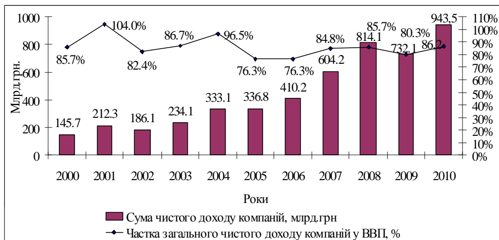
Рис. 1. Обсяг загального чистого доходу ста найбільших компаній України та їхня частка у ВВП країни відповідного року у 2000-2010 рр.