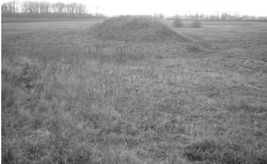
Рис. 2. “Motte” на городищі у с. Фалемичі. Вид зі сходу

Фалемичі згадані у літописі 1157 р. як Хвалимичі. С. Терський пов’язує походження цієї назви з іменем першого власника Хвала і припускає існування боярської садиби, яку локалізує на мисах східніше та північніше від сучасного села. На території городища, на його думку, у XII – XVIII ст. існувало містечко із замком [20, с. 109].