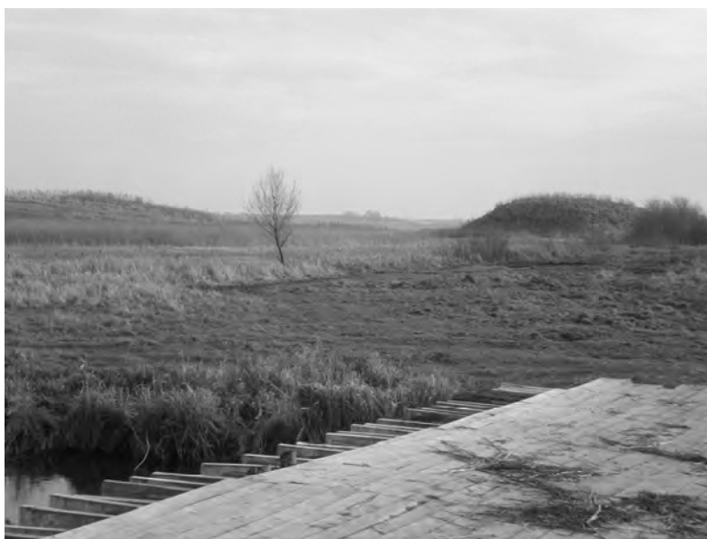
Рис. 1. Городище у с. Фалемичі. Вид з північного заходу

Цікавою планувальною особливістю городища у Фалемичах, на яку не звертали уваги попередні дослідники, є розміщення стіжка на захід від двору, у місці найбільшого зближення останцевого підвищення, на якому розміщений комплекс городища, з мисоподібним виступом лівобережної надзаплавної тераси. Тобто, за умови відсутності інших підходів, що у цій топографічній ситуації видається очевидним, на двір укріпленого комплексу можна було потрапити лише через земляний насип.