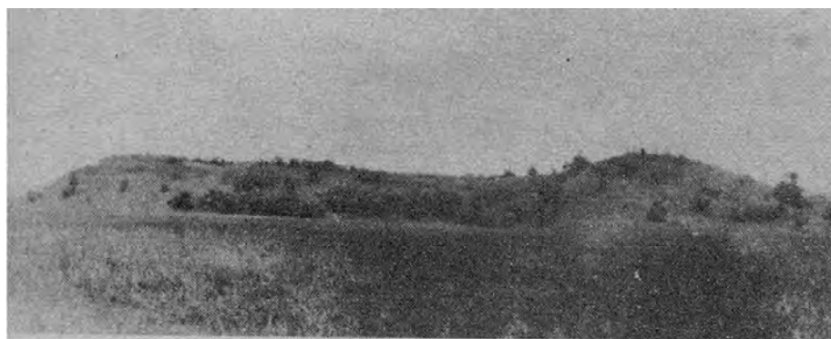
Рис. 4. Гордище у с. П'ятидні за О. Цинкаловським. Вид з півночі

Цікавим прикладом укріплення “ motte and bailey ” є городище у смт. Ратно . Особливої цінності цій пам'ятці надає можливість її історичної інтерпретації, зокрема, зв'язок городища з існуванням Ратенського князівства та становленням князівського роду Сангушків. Ратенське князівство, входячи до складу коронних земель вже з другої половини XIV ст., зазнавало відчутних західних впливів, зокрема і у фортифікаційному будівництві. Хоча насип і не зберігся до нашого часу, його надійно зафіксував П.О. Раппопорт.