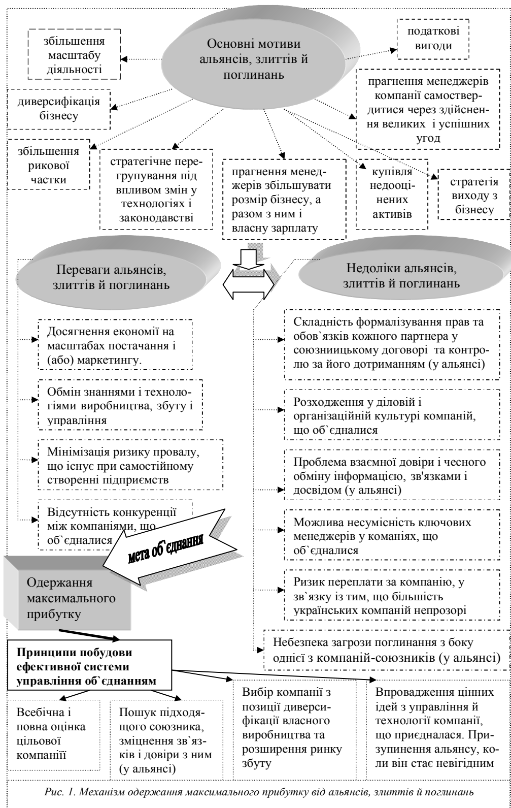
Рис. 1. Механізм одержання максимального прибутку від альянсів, злиттів й поглинань

досліджено наступний механізм отримання максимальної вигоди від альянсів, злиттів й поглинань, виходячи з основних мотивів злиттів і поглинань, їх основних переваг і недоліків (рис.1).