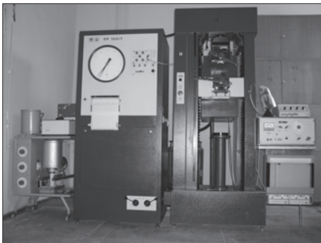
Рисунок 1. Внешний вид универсальной испытательной машины FP-100/1

где h_0 — начальная высота образца, мм; F_0 — начальная площадь образца в плане, мм 2 ; K_0 — средняя жесткость