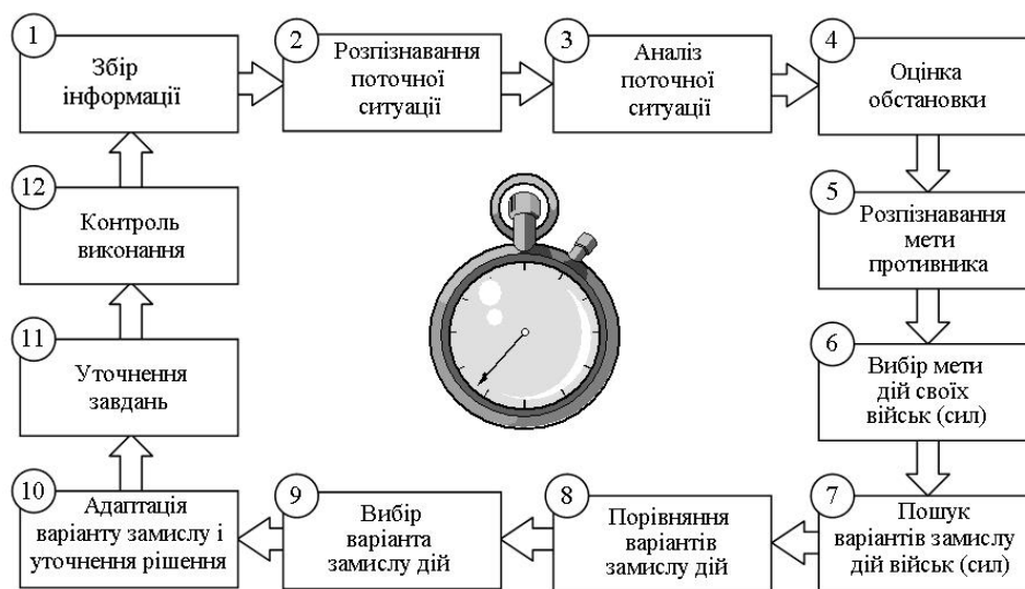
Рис. 2. Схема циклу управління з процесами підготовки й прийняття рішення на початку реалізації плану воєнної діяльності

Від етапу до етапу підготовки і ведення воєнних (бойових) дій функціональні завдання органів управління змінюються за своїм змістом. Так, якщо на етапі завчасної підготовки ситуації формувалися безпосередньо органами управління, то при завершенні етапу безпосередньої підготовки, противник розкриває свою діяльність й командир з наявного переліку формалізованих ситуацій вибирає ту, яка найбільш підходить до реальних умов (2 – рис. 2 і рис. 3). Якщо на етапі завчасної підготовки органи управління формували варіанти дерев цілей, то наприкінці етапу безпосередньої підготовки вони здійснюють розпізнавання можливих цілей збройної боротьби, тим самим розпізнають і варіант замислу дій противника (5, 6 – рис. 2).