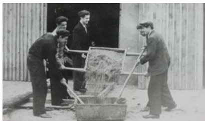
Студенти на відбудові навчального корпусу №1. 1954 р.