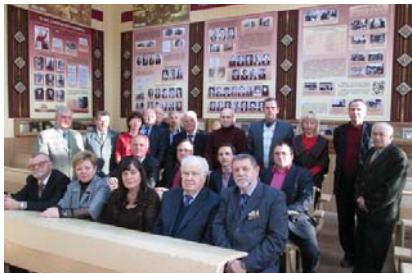
Відкриття музею історії факультету (листопад 2013 року)