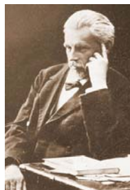
М. Ф. Сумцов – фольклорист, етнограф, професор академік ВУАН