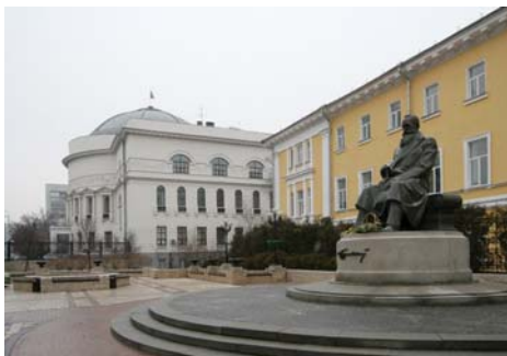
Будинок Центральної Ради (сучасний вигляд)

У час національно-визвольних змагань українського народу у Полтаві з'явився ще один навчальний заклад, який відіграв важливу роль у становленні вищої педагогічної освіти в краї. На розі сучасних вулиць Шевченка і Комсомольської розташований однопверховий цегляний будинок, споруджений у 90-их роках XIX століття. Будинок цей не має якихось архітектурних прикмет і навряд чи заслуговував би на увагу краєзнавців, якби не одна обставина. Річ у тім, що тут у 1918-1921 роках функціонував перший у нашому місті й третій в Україні,