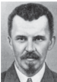
Ф. І. Шміт – візантолог, археолог, мистецтвознавець, професор, академік ВУАН