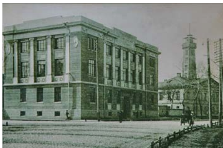
Будинок по вул. Луначарського, 2, де в 1920-их – 1930-их рр. працював історичний факультет ІНО, ІСВ та педінституту

Оскільки більшовицьке керівництво не влаштовувала діяльність заснованого в умовах Української революції Історико-філологічного факультету в Полтаві, 6 жовтня 1920 року Головний комітет професійно-технічної та спеціально-наукової освіти УСРР (Укрголовпрофосвіта) прийняв постанову, якою передбачалося злиття Полтавського педагогічного інституту й Історико-філологічного факультету в єдиний навчальний заклад. Тому