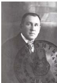
С. М. Кульбакін – філолог-славіст, паліограф, професор, член- кореспондент РАН