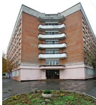
Гуртожиток №1 по вул. Монастирська, 7, де проживають студенти-історики