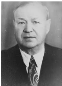
Ф. А. Редько