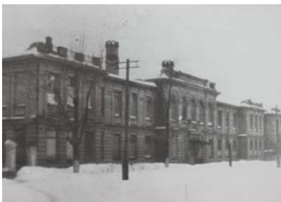
Руїни приміщень педінституту. 1943 р.

По закінченню радянсько-нацистської війни склалися більш сприятливі можливості для розвитку інституту. На роботу та навчання поверталися демобілізовані воїни, поступово відбудовувались інститутські приміщення, поліпшувались матеріальні умови для навчання та побуту викладачів і студентів.