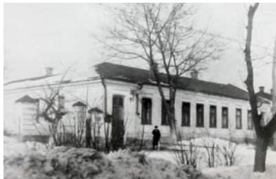
Будинки, у яких тимчасово розміщувався педінститут після визволення Полтави від німецько-фашистських окупантів