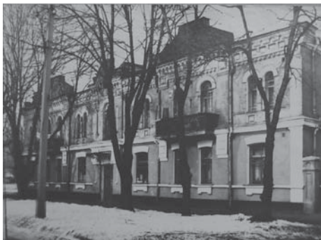
Будинок по вул. Новокременчуцькій (нині Лідова), 12, у якому в 1919-1921 рр. працював Полтавський педагогічний інститут. (Сучасний вигляд)

Створення нової системи вищої освіти повинно було вирішити й долю колишніх учительських інститутів, діяльність яких в Україні в роки Громадянської війни часто порушувалася та припинялася. У радянській Росії ще в середині 1918 року розпочалося перетворення учительських інститутів у педагогічні з чотирьохрічним терміном навчання. На