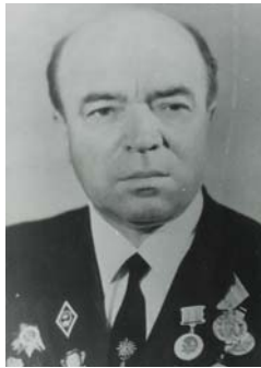
В. Г. Євтушенко