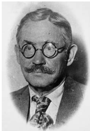
В. М. Верховинець – професор Полтавського ІНО, відомий композитор і етнограф

Та вольовий і допитливий юнак прагнув учитися, хоча в буремні воєнні та голодні повоєнні роки навчатися було надважкою справою.