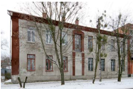
Будинок по вул. Фабрикантській (нині Балакіна), 14, де в 1914-1917 рр. розміщувався Полтавський учительський інститут. Сучасний вигляд.