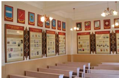
Кабінет історичного краєзнавства