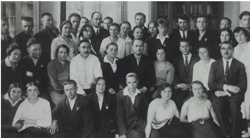
Зустріч групи викладачів Полтавського педінституту з відомими українськими письменниками Миколою Бажаном (другий ряд шостий зліва) та Павлом Тичиною (другий ряд восьмий зліва). Фото 1935 р.

У 1935 році в Україні проводилася реорганізація й укрупнення факультетів педагогічних інститутів. У зв'язку з цим студенти історичного факультету були переведені на навчання до Харкова, а до Полтави прибули студенти-філологи з Кременчуцького, Лубенського і Сумського педінститутів, у якій філологічні факультети закривалися. Що стосується викладачів вітчизняної, всесвітньої історії, суспільствознавчих дисциплін, то вони переважно залишилися працювати в Полтавському педінституті, де читали лекції і проводили семінарські