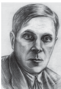
М. Я. Рудинський – археолог, історик мистецтв, один із керівників українського пам'яткоохоронництва