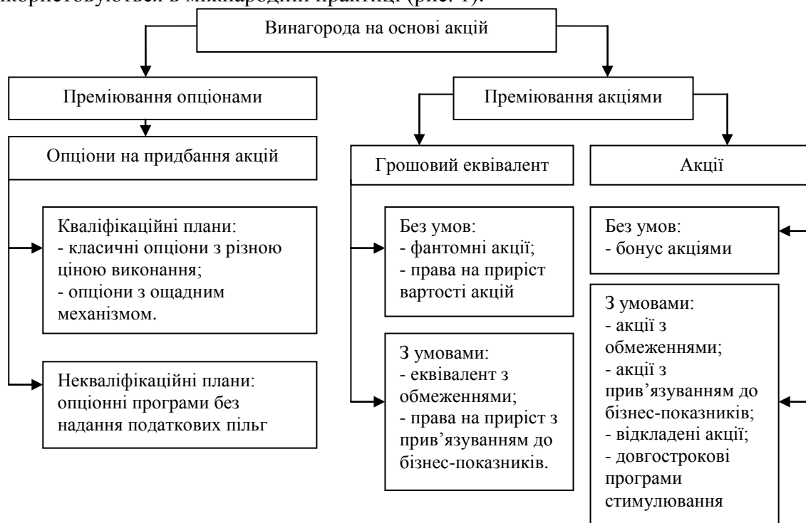
Рис. 1. Стимулювання працівників на основі акцій в міжнародній практиці [3]

Розглянемо детальніше порядок стимулювання працівників такими видами ІВК як акції та опціони на акції. Існують різні схеми стимулювання працівників на основі акцій, що використовуються в міжнародній практиці (рис. 1).