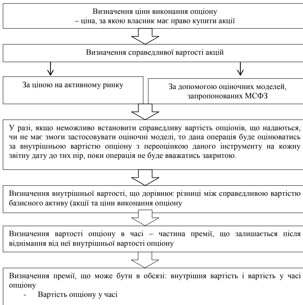
Рис. 2. Алгоритм визначення вартості опціону

На основі проведених досліджень пропонуємо алгоритм визначення вартості опціону, що наведений на рис. 2.