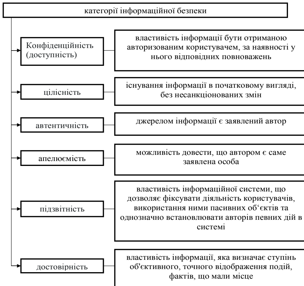
Рис. 1. Категорії інформаційної безпеки

США для обов'язкової звітності корпоративними інсайдерами визнаються службовці компанії, директора та акціонери, які володіють більше 10 % акціонерного капіталу компанії.